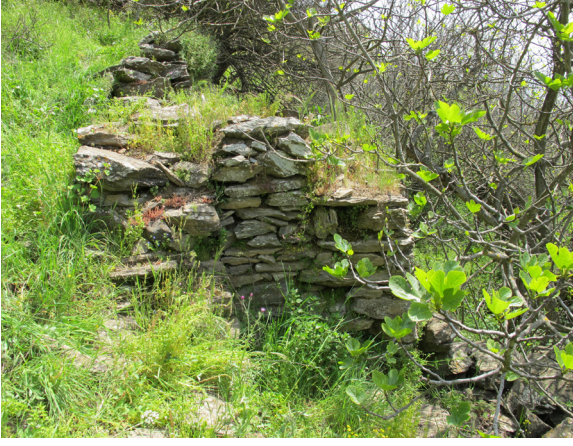
Fig. 2: Duvar kalıntıları