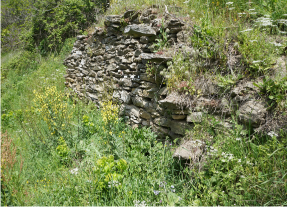
Fig. 3: Merdiven (Batı)

dışında kalan doğu uçta ise dikdörtgen planlı bir mekân yer alır (Fig. 1). Düz atkılı lentolu kare bir pencere açıklığı ve duvarda bulunan niş günümüze ulaşmıştır. Ayrıca bu bölümde, mekanlar arası geçişi sağlayan kapı ayırt edilebilmektedir. Bu setin üstünde bulunan terasın güney duvarında farklı kotları bağlayan özgün merdiven yer alır.