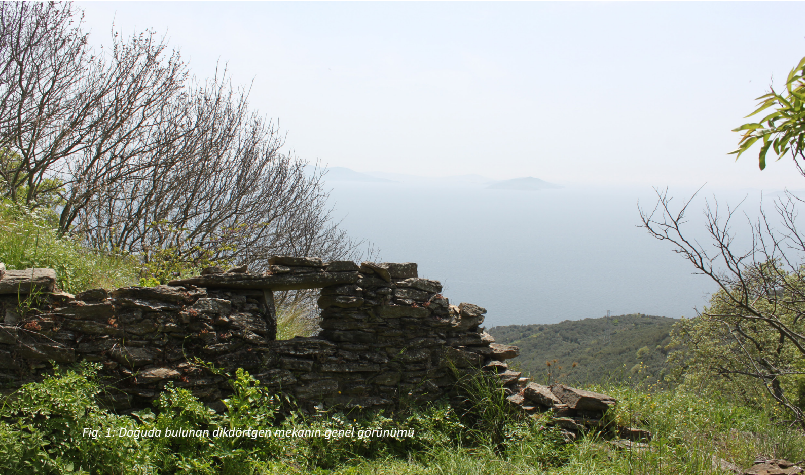
Fig. 1. Doğuda bulunan dikdörtgen mekânin genel görünümü

Manastır kompleksi duvarlarla çevriliydi. İki katlı yapıda, keşişler ve misafirler için birçok oda bulunmaktaydı. Yapının iç avlusunda küçük ölçekli Agios Ermolaos Kilisesi yer alıyordu. Manastırın dış avlusu ağaçlar ve çiçeklerle çevrilmişti. Manastırın çevresinde üzüm bağları ve tarlalarla birlikte, Gündoğdu köyü yakınında 300 stremma (1 stremma = yak. 4 dekar) büyüklüğünde tarlaları vardı